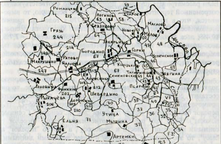
Рис.3. Схема размещения дач Генерального межевания на территории современного музея-заповедника Бородино.